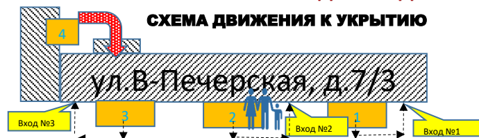
СХЕМА ДВИЖЕНИЯ К УКРЫТИЮ